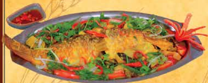
Cá Chép om dưa

Món đặc sản Rơm Vàng mang tinh hoa Bắc Bộ khẳng định chinh phục cả những vị khách khó tính nhất!!!