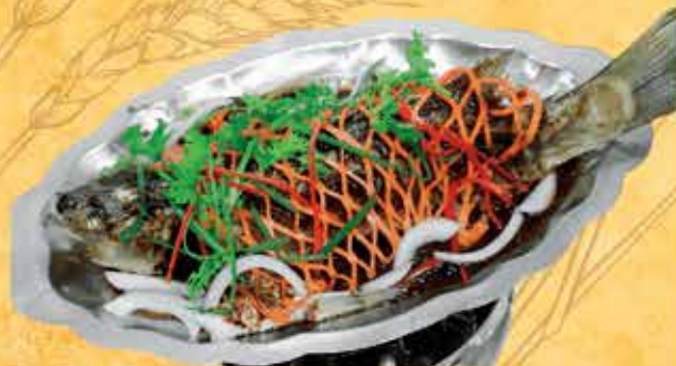
Cá Chép rim tương bần