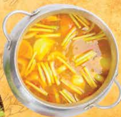
Cá Chép nấu riêu